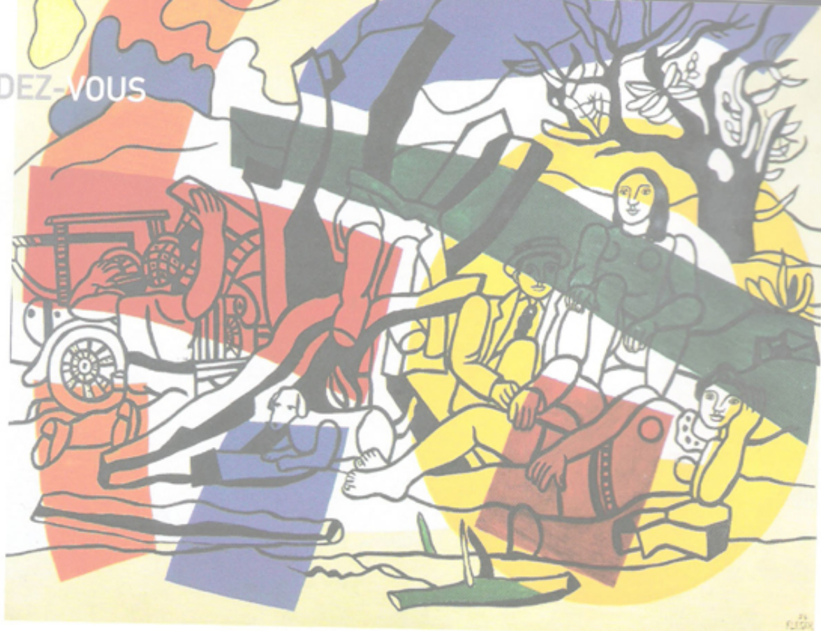
Fernand Léger, « La Partie de campagne », 1954, huile sur toile, 245 x 301 cm. © Photo Archives Maeght, © ADAGP Paris 2006