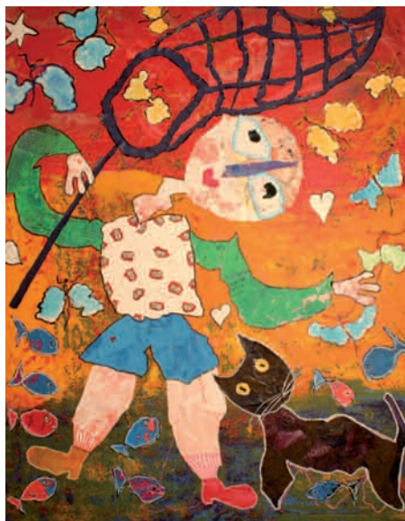
« Chasse aux papillons » - 2007

Espace Création - Galerie Saint-Louis 6 rue Notre Dame - 83000 Toulon Tél. 04 94 22 45 86 www.espacecreation.org En permanence